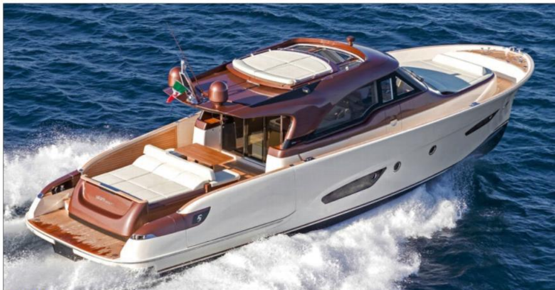
Le Solaris 55 Power navigue presque à plat, l'étrave hors de l'eau. Le fort tulpage de l'étrave renvoie les embruns à l'extérieur.