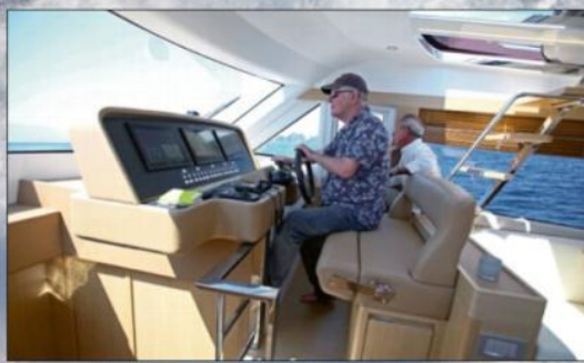
La banquette en cuir du poste de pilotage est confortable. L'instrumentation Garmin Glass Cockpit contrôle tout le bord.

Texte Antoine Berteloot