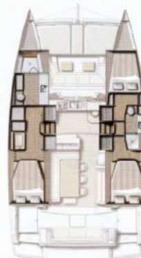
Version 3 cabines / 2 sdb