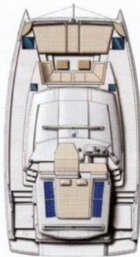
Pont et flybridge