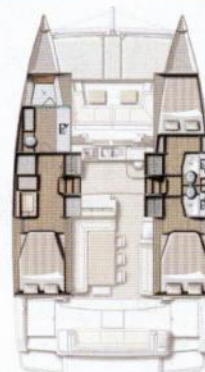
Version 3 cabines / 3 sdb