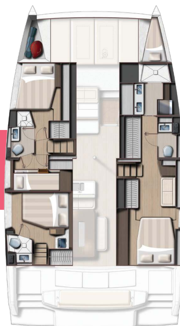
Owner's version 4 cabins and 3 baths Version propriétaire 4 cabines / 3 sdb