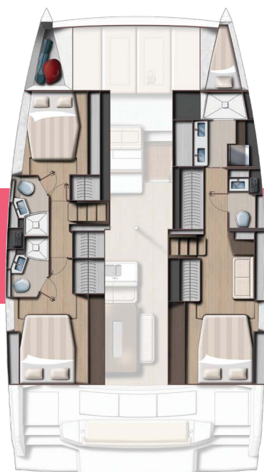
Owner's version 3 cabins and 3 baths Version propriétaire 3 cabines / 3 sdb

* Equipment according to chosen Pack and options - Equipement selon Pack et options choisis