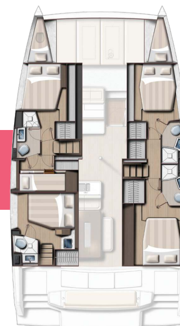
5 cabins and 4 baths version Version 5 cabines / 4 sdb