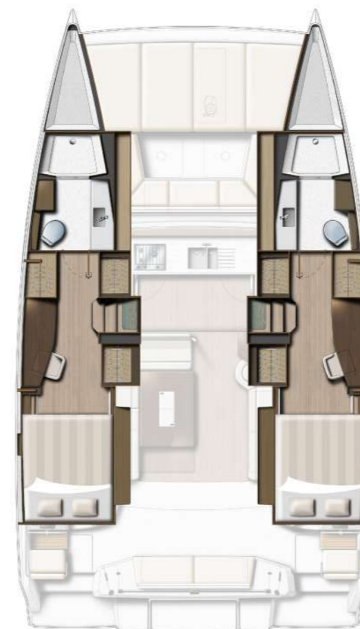
2 DOUBLE CABINS / 2 HEADS VERSION VERSION 2 CABINES DOUBLES / 2 SDB