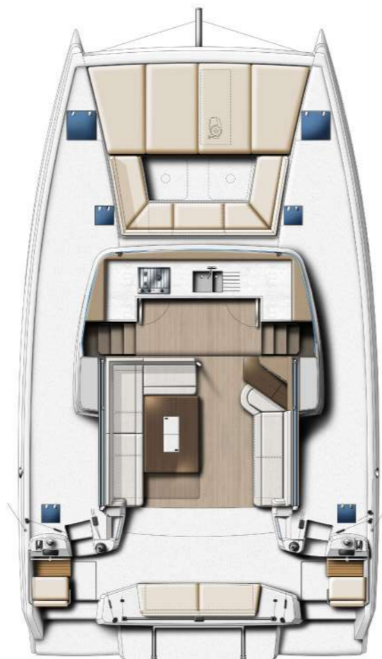
COCKPITS AND SALOON COCKPITS & SALON