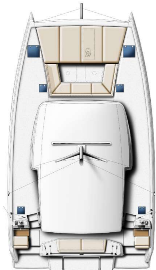
DECK AND FLYBRIDGE PONT & FLYBRIDGE